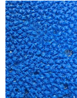
製造したコレクトレザー

※1 私たちが脱脂粉乳から分離したカゼインから独自開発した皮革風素材につけた名称